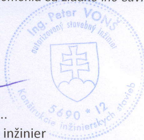
..... Autorizovaný inžinier Projektant stavby